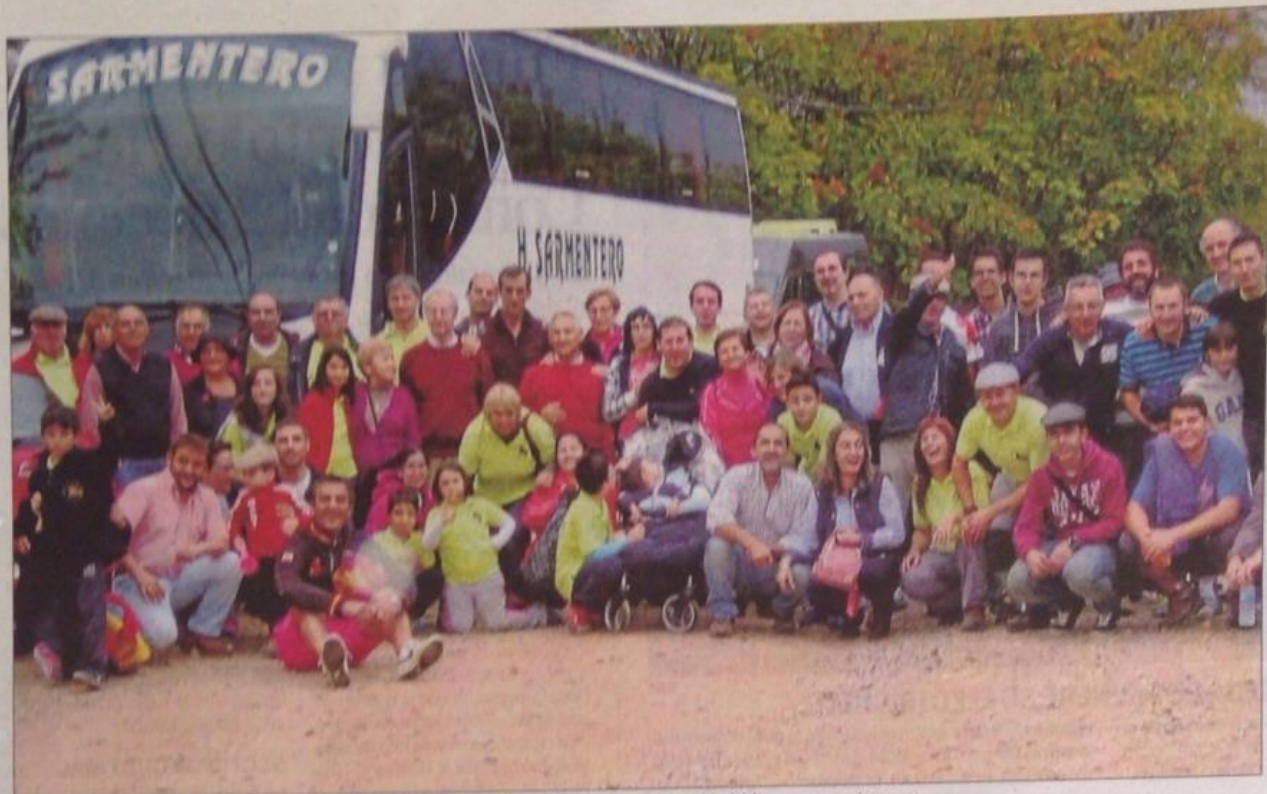
Miembros de la asociación taurina La Empalizada de Montemayor de Pililla en su viaje a Madrid.